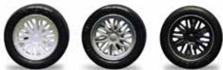
5422 - Ø 17mm BBS white